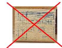
5 pav. Ženklas neįskaitomas.