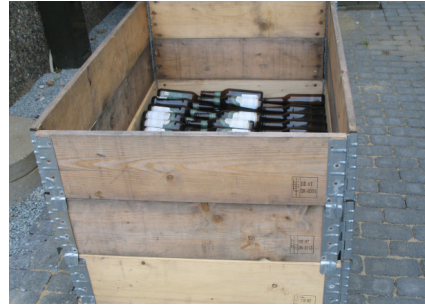
2 pav. Ženklinimas pagal ISPM 15.

MPM, naudojama pervežant bet kokios rūšies prekes iš trečiųjų šalių, išskyrus Šveicariją, turi atitikti ISPM 15 reikalavimus.