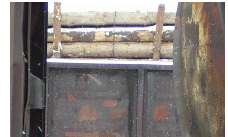
4 pav. Pagalbiniė spygliuočių mediena su spygliuočių medienos kroviniu.

Pagalbinei medienai po tokios pat rūšies medienos kroviniu, o taikomi tokie pat reikalavimai kaip ir importuojamai medienai!