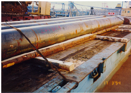
1 pav. Medinė pakavimo medžiaga po kroviniu.

4. MPM naudojama tokių krovinių gabenimui, kuriems paprastai nėra taikoma fitosanitarinė kontrolė.