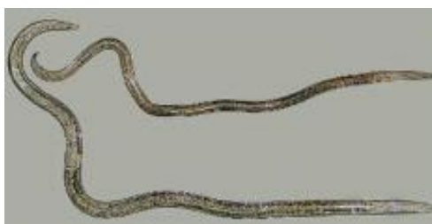
Bursaphelenchus xylophilus Steiner and Buhere) Nickle et.al.