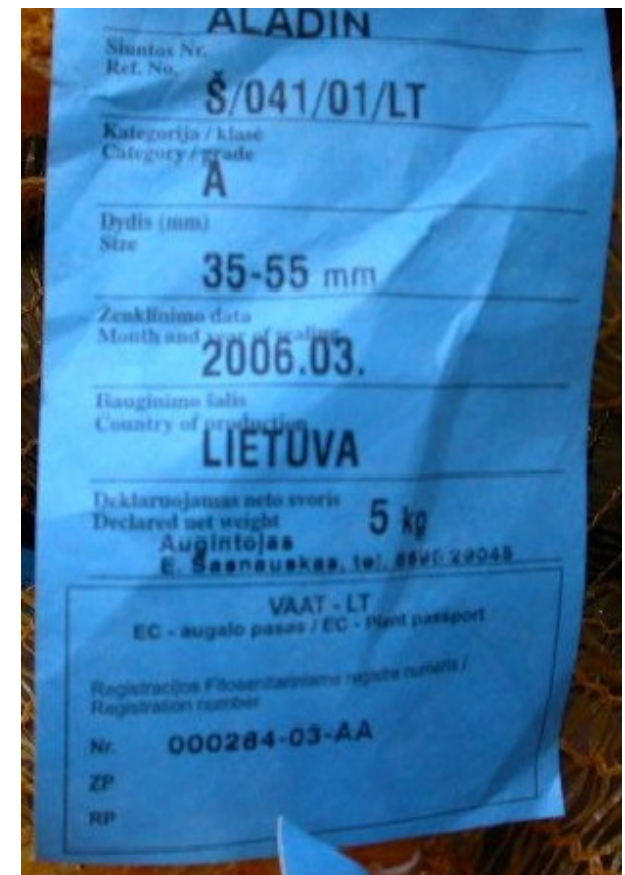
Sėklinių bulvių etiketė – augalo pasas