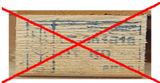
5 pav. Ženklas neįskaitomas