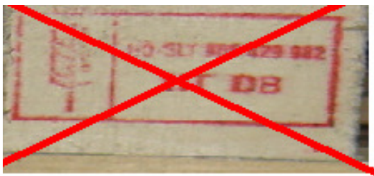
8 pav. Ženklas raudonos ar oranžinės spalvos

Šalių, reikalaujančių, kad importuojama MPM atitiktų ISPM 15 reikalavimus, sąrašą rasite adresu http://www.ispm15.com