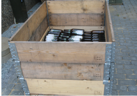
2 pav. Ženklinimas pagal ISPM 15

MPM, faktiškai naudojama pervežant visų rūšių objektus iš trečiųjų šalių, išskyrus Šveicariją, turi atitikti ISPM 15 reikalavimus.