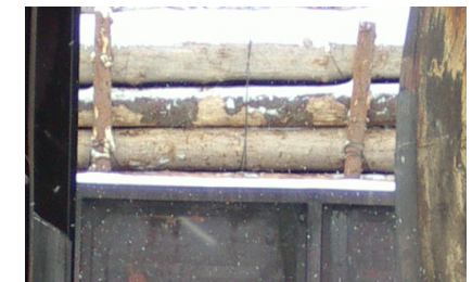
4 pav. Pagalbini spygliuočių mediena su spygliuočių medienos kroviniu

Pagalbinei medienai po tokios pat rūšies medienos kroviniu ISPM 15 reikalavimai netaikomi, o taikomi tokie pat reikalavimai kaip ir importuojamai medienai!