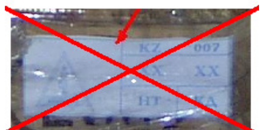
6 pav. Ženklas lengvai nuimamas – priklijuotas