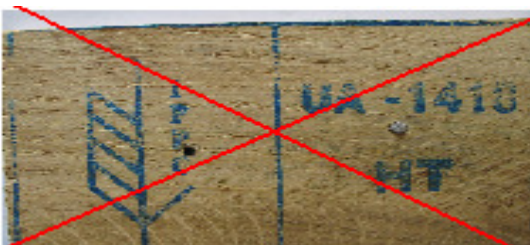
7 pav. Ženklas lengvai nuimamas – prikaltas