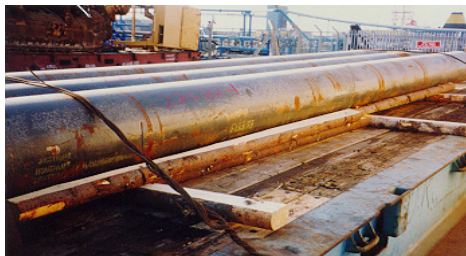
1 pav. Medinė pakavimo medžiaga po kroviniu

4. MPM naudojama ir tokių krovinių gabenimui, kuriems paprastai nėra taikoma fitosanitarinė kontrolė.