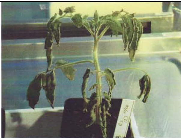
3 pav. Vystantis pomidoro augalas