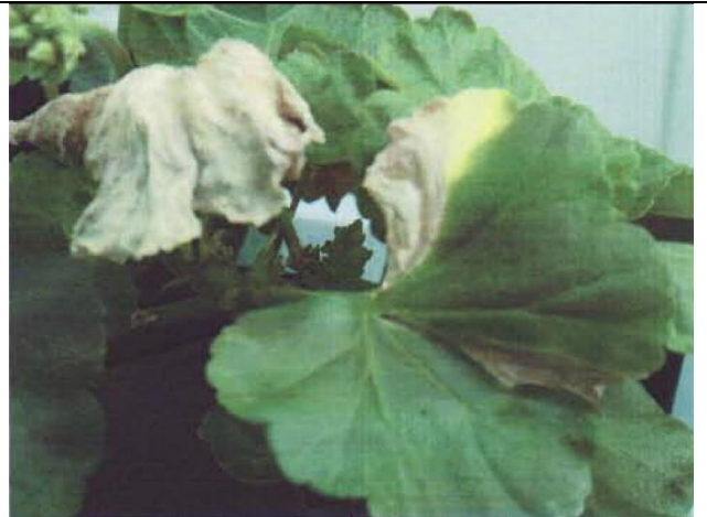
2 pav. Pelargonijų „skėčiai“ ir „trikampiai“