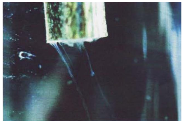
6 pav. „Vandens testas“