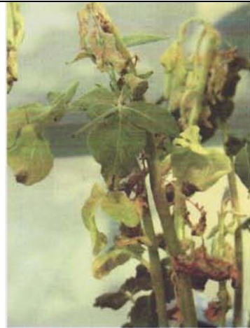
1 pav. Sergantis bulvės augalas