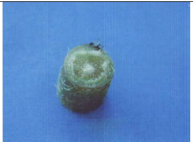
4 pav. Pieno spalvos skystis skersiniame augalo stiebo pjūvyje